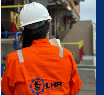
Levantamento para Adequações à NR-35