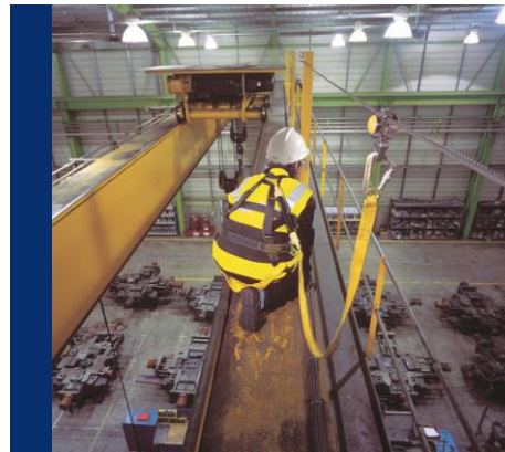
Instalação de Linha Vida Horizontal