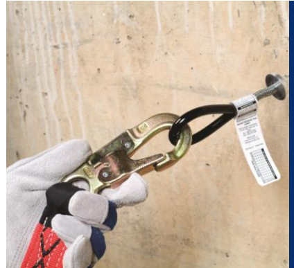
Projetos de Sistemas de Ancoragem