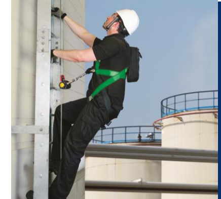
Instalação de Linha Vida Vertical