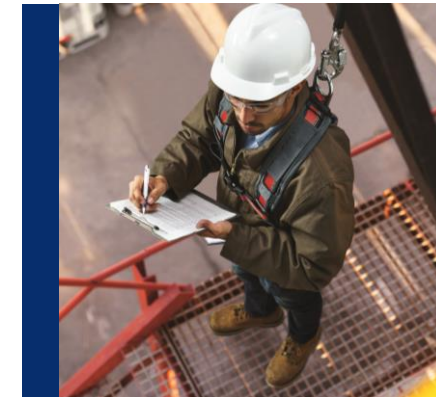
Inspeção, Manutenção e Re-Certificação Gerenciamento de Projetos de Engenharia